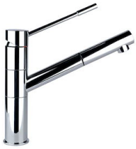
龙头 Lorenzo 8466 000